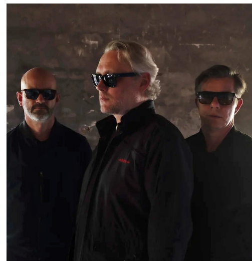
Northern Lite – A History of Love Tour 16.11.2024 | 20:00 Uhr | Großer Saal