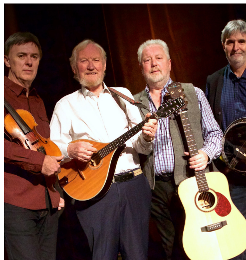
The Dublin Legends – Live 2024 22.11.2024 | 19:30 Uhr | Großer Saal