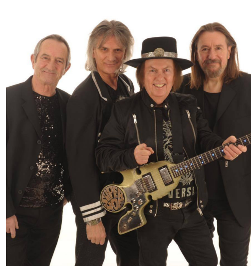
SLADE – Celebrating 50 Years of NOIZE 19.10.2024 | 19:30 Uhr | Großer Saal