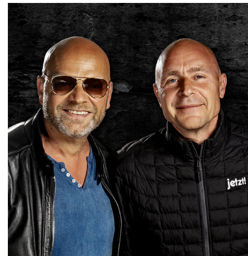
die feisten – jetzt! 24.11.2024 | 18:00 Uhr | Großer Saal