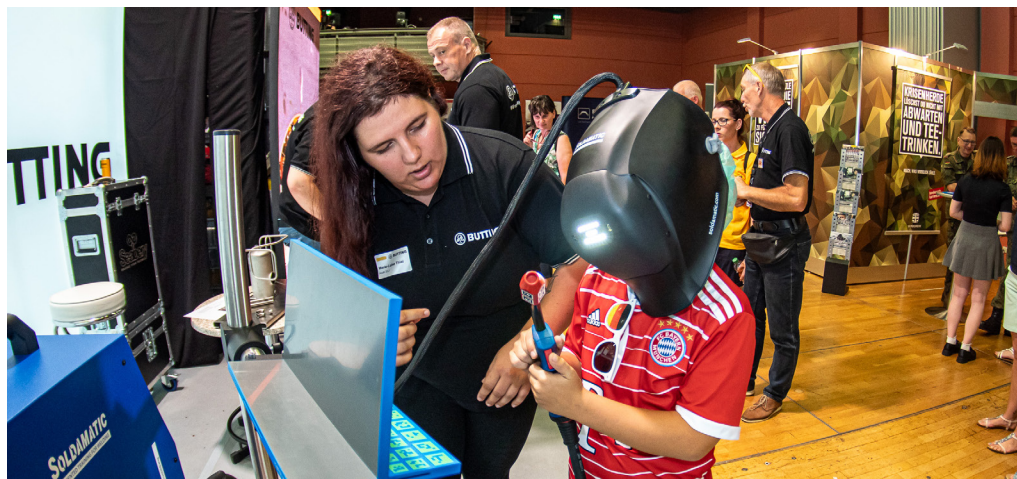
Kleiner Saal, Inkontakt 2023

Am zweiten Septemberwochenende trifft geballtes wirtschaftliches Knowhow der Region auf Informationen über attraktive Ausbildungs- und Arbeitsmöglichkeiten für die Generation von morgen, auf einen Treffpunkt der Macherszene und auf ein buntes Unterhaltungsprogramm. Es ist wieder Zeit für DAS Messehighlight des Jahres in Schwedt: die Verbundmesse sam meets INKONTAKT .