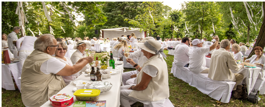
Dîner en blanc September 2023

Unser Förderverein und wir laden Sie herzlich zum charmanten Spielzeitauftakt in den Europäischen Hugenottenpark ein. Im sommerlichen, festlich geschmückten Ambiente des Parkes heißt es dann wieder: Speisen und Getränke auspacken, miteinander ins Gespräch kommen und eine schöne gemeinsame Zeit verbringen. Das Picknick ganz in Weiß veranstalten wir bereits zum sechsten Mal, und ja – wir haben es bei unseren französischen Nachbarn mit ihrem „savoir-vivre“, der Kunst zu leben, abgeschaut – Paris in der Uckermark sozusagen. Neben kulinarischen Genüssen stehen auch künstlerische Snacks auf dem Programm: unser Schauspielen-