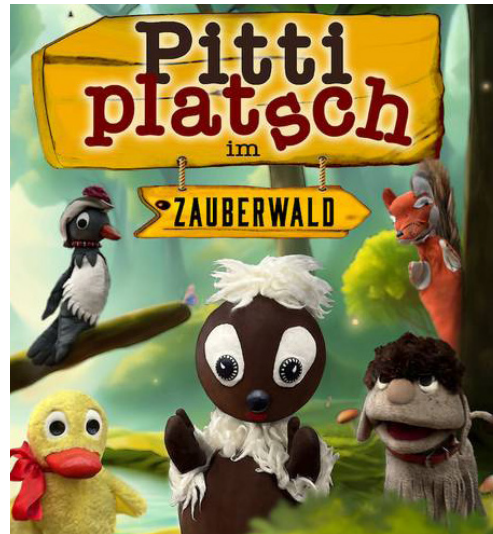
Pittiplatsch – Pittiplatsch im Zauberwald 2.11.2024 | 16:00 Uhr | Großer Saal