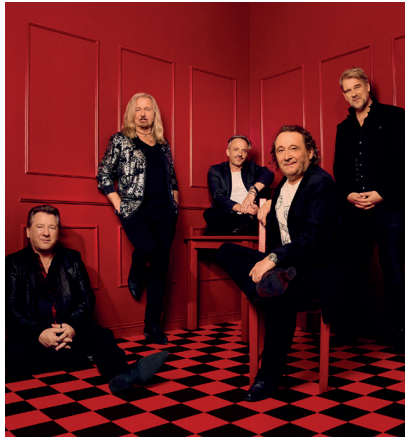
Karat 50 Jahre Karat 15.3.2025 | 19:30 Uhr | Großer Saal