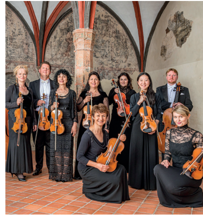
Kleines Orchesterwerk Preußisches Kammerorchester 30.3.2025 | 16:00 Uhr | Kleiner Saal