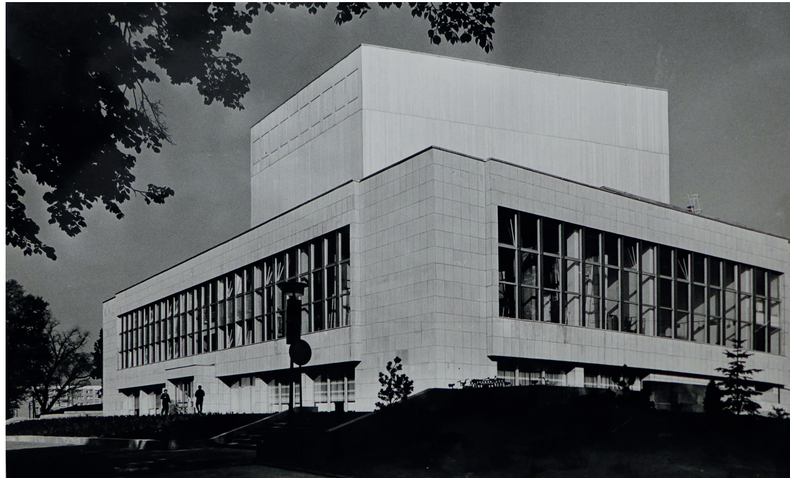
Kulturhaus Schwedt, Ansicht von Ost, | oben: Kulturhaus Schwedt, Baustellenfoto 1976-1978

1977 wurde mit der Umsiedlung des Prenzlauer Theaters nach Schwedt ein eigenes Theaterensemble in der Stadt etabliert. Das Prenzlauer Theater wurde