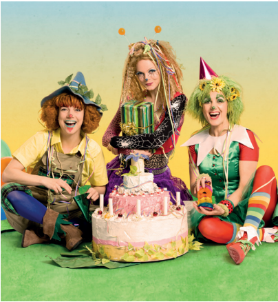
Der Traumzauberbaum Das Geburtstagsfest 2.3.2025 | 16:00 Uhr | Großer Saal