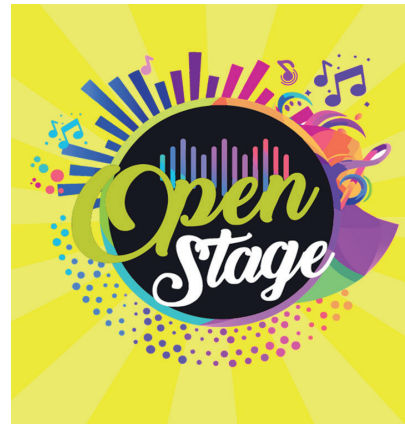
Open Stage Eure Bühne, Eure Show 26.4.2025 | 18:00 Uhr | Kleiner Saal