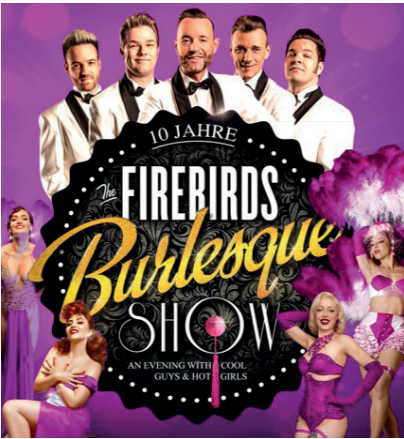
The Firebirds Burlesque Show 2025 30.3.2025 | 18:00 Uhr | Großer Saal