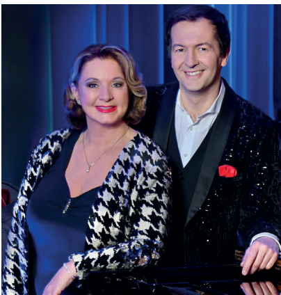
Die Udo Jürgens Story Sein Leben, seine Liebe, seine Musik! 3.5.2025 | 19:30 Uhr | Großer Saal