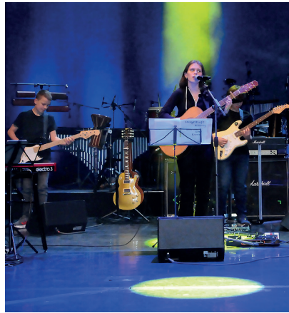
Rock Pop Jazz 2025 Musik- und Kunstschule Schwedt 2.4.2025 | 19:00 Uhr | Großer Saal