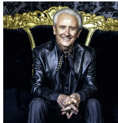
Tony Christie Live mit Band 16.5.2025 | 19:30 Uhr | Großer Saal