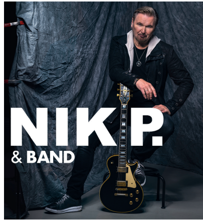
Nik P. & Band Live 4.4.2025 | 19:00 Uhr | Großer Saal