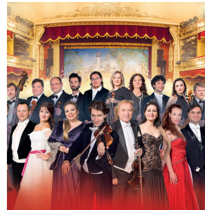
Zauber der Operette Wiener Operetten Revue 2.5.2025 | 16:00 Uhr | Großer Saal